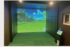
ゴルフシュミレーター