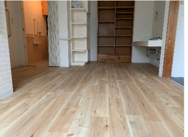
リラクゼーションエリア